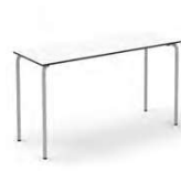
RECTANGLE PLUS 2353