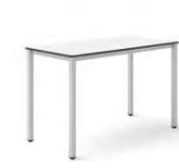
SPACE PLUS 260