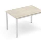
SPACE DESIGN 261