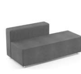
COMPLETE SOFA 12005