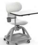
MIA TABLE 1036