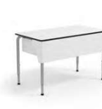
RECTANGLE TEACHER 2355D